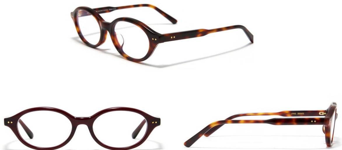
▲圖說: JINS TODAY 潮流風尚系列板料貓眼框(UCF-26S-179)，戴上即是潮流焦點。