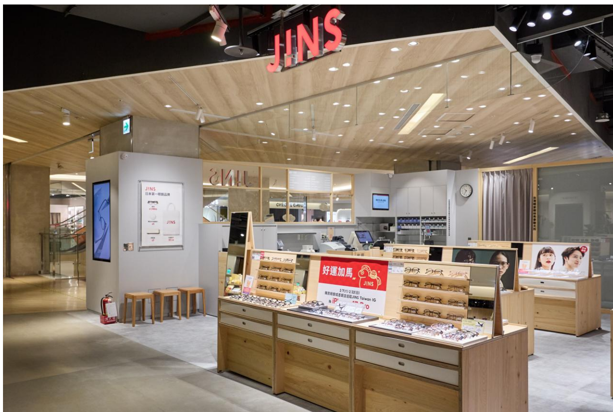
▲圖說: JINS 樹林秀泰店位於百貨二樓，玻璃加上木作搭配凸顯整體簡約質感。

日本銷量第一眼鏡品牌 JINS 持續擴張店鋪版圖，為了填補服務空白區，入駐秀泰生活樹林店，要帶給樹林、下新莊地區居民舒適、快速配鏡的體驗。JINS 看準樹林火車站商圈未來發展與人口成長，選定秀泰生活樹林店做為樹林的第一家店鋪。秀泰生活樹林店位於火車站與行政中心周邊商圈，是該地區第一間綜合型百貨商場，再加上商圈周遭完善的生活機能，以及正在建構中的樹林線捷運，使得樹林區近一年房價緩步上漲中，未來商圈人潮可期。