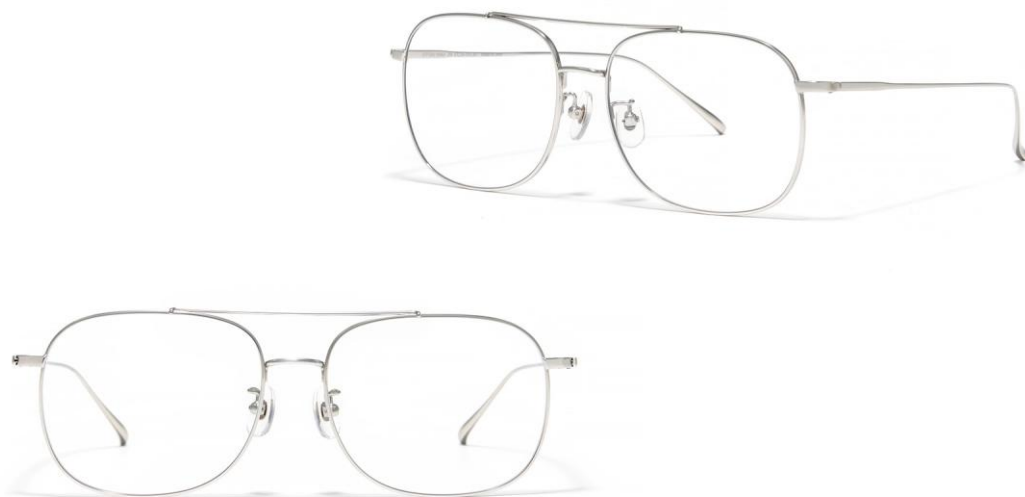
▲圖說: JINS TODAY 潮流風尚系列復古飛行員框(UTF-26S-180)，細邊框襯出精緻臉蛋。