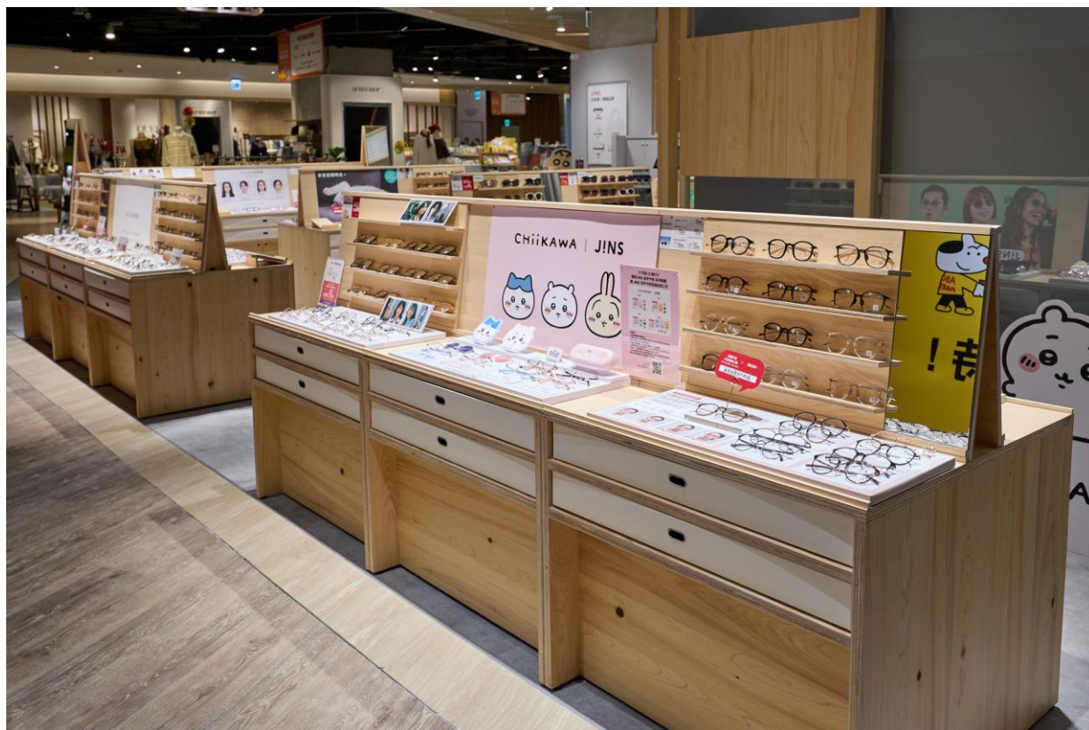
▲圖說台灣首間店鋪使用「野田型設計」的展示櫃，可以根據櫃位大小或陳列機動調整。

簡約風格搭配；日式風的店裝設計讓顧客到店選購眼鏡、等待領取眼鏡時都能放鬆自在的在店內等候。