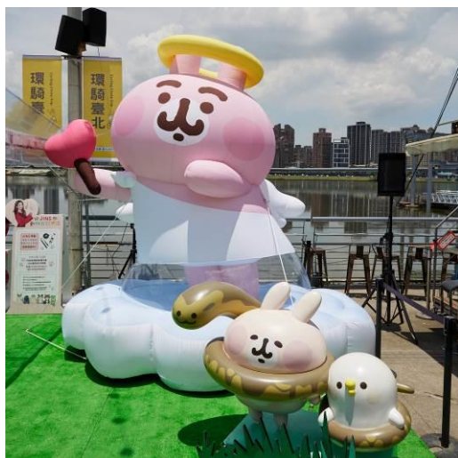
< 圖 > 支持動物平權，粉紅兔兔化身 3 公尺高的動物守護天使

2023 年適逢象徵活力與生機的兔年，不僅回收活動命名為「廢鏡新思 Round 兔」，與民眾產生共鳴，更邀請卡娜赫拉的小動物們擔任動物守護天使，粉紅兔兔化身 3 公尺高氣球，角色細節高度還原，可愛度 MAX，陪伴著徜徉在樂園的動物們，呈現動物平權的溫暖意象。