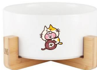
< 圖 > 至 JINS 動物友好樂園完成指定任務，即有機會獲得卡娜赫拉的小動物圖樣木架寵物陶瓷碗。