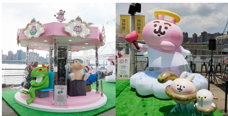
< 圖 > JINS 動物友好樂園，7/15(六)起於大稻埕貨櫃市集展出一個月。

日本銷量第一眼鏡品牌 JINS 延續 2022 年響應 SDGs 目標的超人氣活動「廢鏡新思」計畫，再次號召民眾一起回收廢棄眼鏡，共同推廣循環經濟理念，今年主軸更從環境友善擴大到動物平權，希望透過由廢棄眼鏡打造的大型裝置物「JINS 動物友好樂園」，讓更多人關注動物、寵物的生存權利。