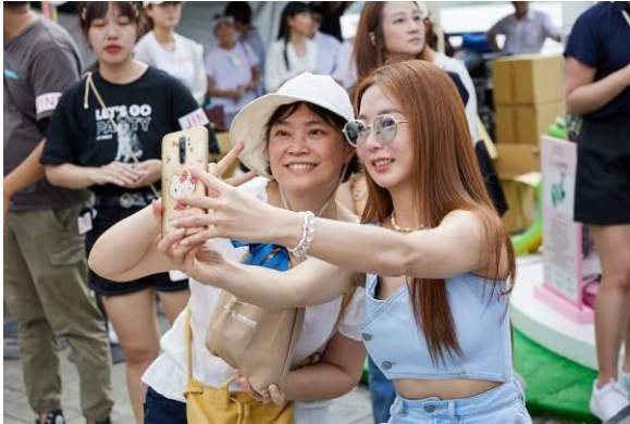
< 圖 > 熱愛毛小孩，女星郭書瑤站台力挺 JINS 動物平權理念。

JINS 為了號召更多民眾關注動物平權議題，展出期間，只要到「JINS 動物友好樂園」與旋轉木馬裡的快樂動物們合照，上傳到個人 IG 且@JINSTaiwan、#JINS 動物友好樂園，並至 JINS 官方 IG 指定貼文留言「友好樂園最給力 守護動物我可以!」，即有機會獲得獨家限量卡娜赫拉的小動物圖樣木架寵物陶瓷碗乙個，郭書瑤也為粉絲示範如何將性感與甜美融合自拍，逗樂台下粉絲。