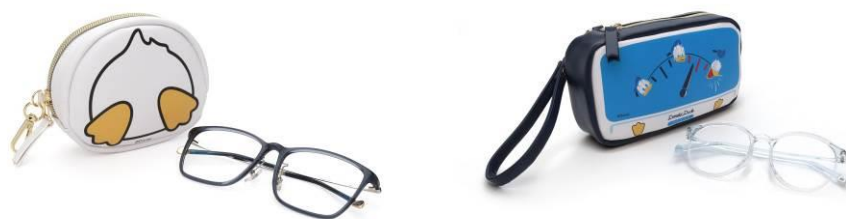
<圖> 方形款以唐老鴨經典配色與造型設計，可輕鬆收納眼鏡或隨身小物，圓形款以鴨屁股圓形為概念設計，小巧精緻。

JINS 迪士尼系列，除了有細節滿滿各式鏡框，還加碼推出可愛又實用的唐老鴨、奇奇蒂蒂收納包，各有方形和圓形兩種款式，不論是放眼鏡還是隨身小物都很方便，同樣是粉絲不能錯過的單品配件。