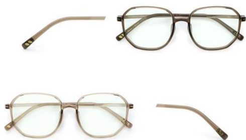
<圖> 奇奇蒂蒂款-鏡腳尾端印有奇奇、蒂蒂，還有可愛的橡果圖案。