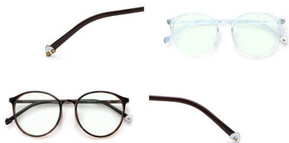
<圖> 唐老鴨款-清爽的淺藍色、時尚的木紋棕色兩種款式。

現代人生活中隨時充斥著 3C 產品，本次 JINS 迪士尼系列，同步推出 2 款各 2 色的無度數濾藍光眼鏡，皆採用輕盈舒適的 TR 材質，搭配 25% 的無度數濾藍光鏡片，兩款鏡腳分別有超 cute 的唐老鴨頭像和屁股圖案、奇奇蒂蒂的頭像和橡果圖案，不但舒緩雙眼疲勞，也舒緩心情。