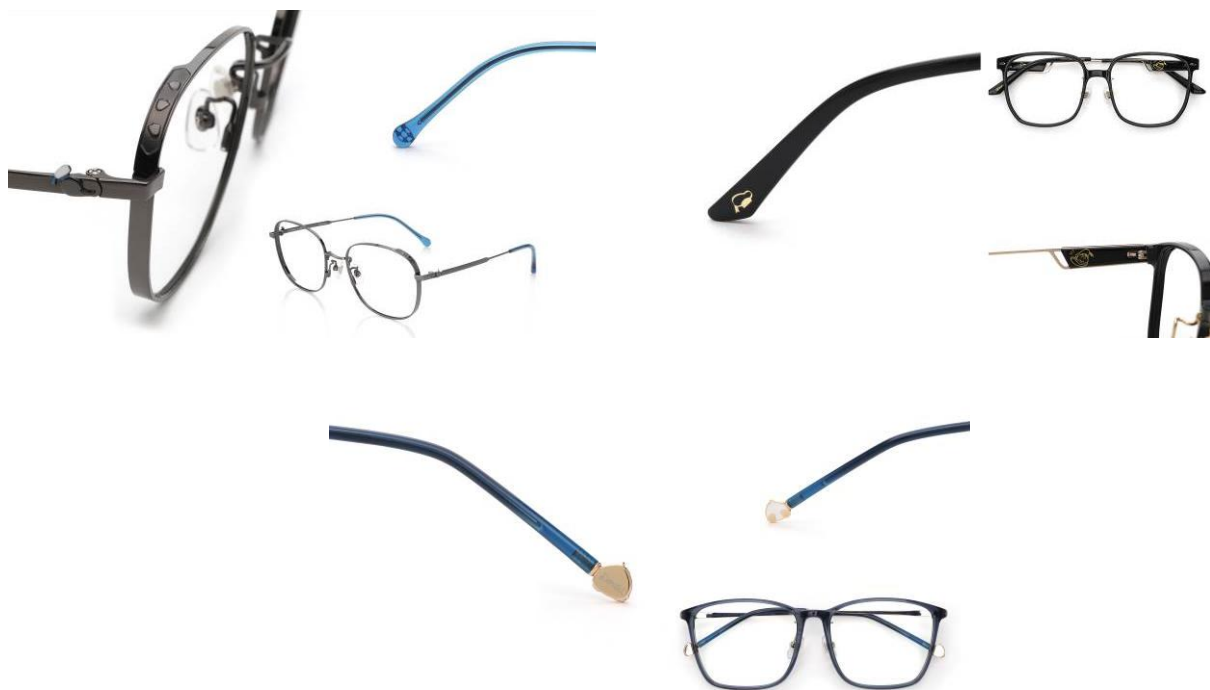
<圖> 唐老鴨款式-鏡框邊緣的腳印浮雕、鏡腳的水手帽、鴨屁股圖案，增添逗趣感。

唐老鴨系列鏡框共有 3 種款式，鈦金屬材質款，鏡框邊緣有著充滿趣味感的唐老鴨腳印，鏡腳前端跟尾端，分別放上唐老鴨浮雕和經典配件救生圈圖案；另外兩款則都是膠框與金屬的混合材質款式，其中經典大框款除了在鏡腳上藏有唐老鴨頭像、水手帽、可愛鴨嘴圖樣，多了點童趣感外，鏡腳前端的加寬設計，也讓配戴更穩定；透明框款多了唐老鴨代表色的深海藍款，搭配鏡腳尾端超萌的小鴨掌與鴨屁股圖樣，創造獨有的俏皮感。