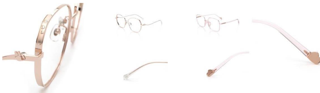
<圖> 黛絲款式-鏡框、鏡腳滿滿的愛心設計，展現甜美氣息。

黛絲系列鏡框共有 2 種款式，也透過鏡框、鏡腳以及配色，融入代表性元素，展現角色性格，像是鈦金屬材質款，前框邊緣雕刻愛心圖樣，鏡腳前端有立體黛絲頭像浮雕與招牌的蝴蝶結裝飾，尾端則有象徵著純潔天真形象的雛菊圖案；TR 材質款，鏡腳尾端的愛心裝飾，內藏著黛絲頭像，2 款皆展現甜美氣息。