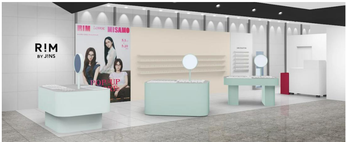
RIM loves MISAMO POP-UP STORE 渋谷スクランブルスクエア店