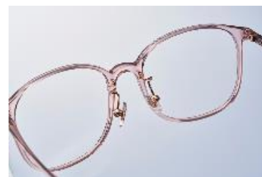
シリコン製の鼻パッドを採用することでより滑りにくく